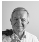
Lotti + Pavarani Architetti, Tassoni and Partners, Studio LSA PARCO ARENA CAMPOVOLO, PEDESTRIAN BRIDGE E MASTERPLAN PARCO DELLO SPORT DI REGGIO EMILIA