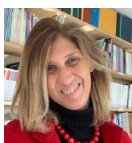
Alessandra Boccalari - Presidente Ordine degli Architetti di Bergamo